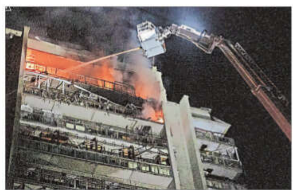
Rescue workers put out a fire of a building damaged following a Russian strike in Ukraine