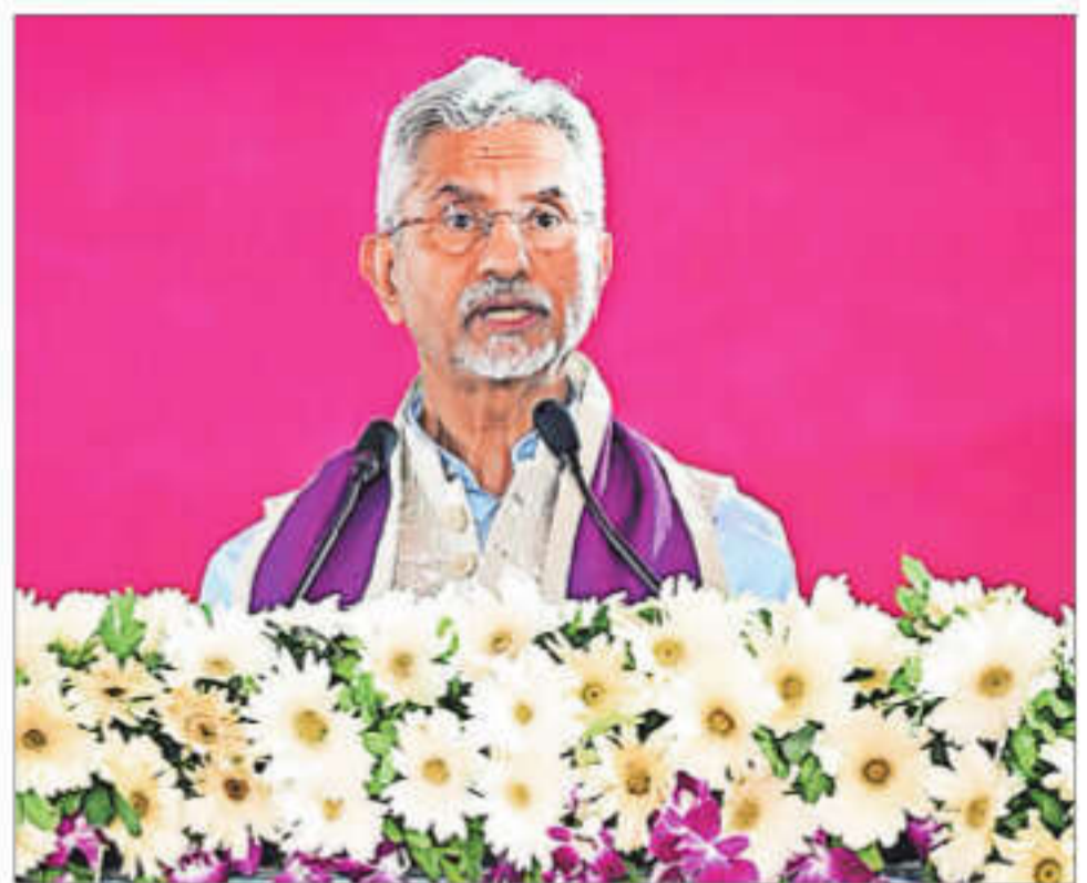
External Affairs Minister S Jaishankar

A GROUP OF stranded Indian fishermen in Iran are returning home through Armenia on Saturday, the government said.