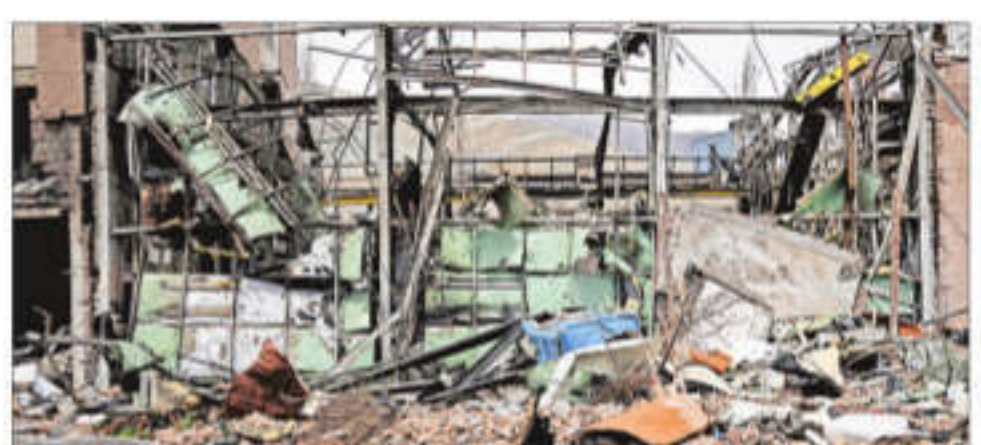
A section of Shahid Beheshti University is seen after being destroyed in US-Israeli airstrikes in Tehran, Iran