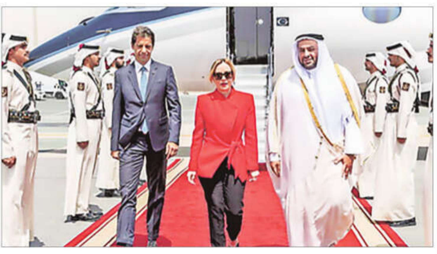
Italian PM Giorgia Meloni arrives in Doha, Qatar