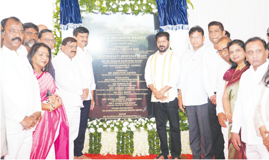
శంకుస్థాపన చేస్తున్న సిఎం రేవంత్, మంత్రులు తదితరులు

“హైదరాబాద్ చారిత్రాత్మక నగరం.. అంతర్జాతీయ స్థాయిలో హైదరాబాద్ గుర్తింపు పొందడానికి ఆనాటి కులీ కుతుబ్ షాహీ నుంచి ఈ నాటి వరకు ఎంతోమంది కృషి చేశారు.. వారి కృషి వల్లే ప్రపంచ చిత్రపటంలో ఒక గొప్ప నగరంగా ‘హైదరాబాద్ కీర్తి ప్రతిష్టలు దక్కాయి’ అని సిఎం రేవంత్‌రెడ్డి అన్నారు. కొంత మంది అభివృద్ధిని అడ్డుకోవడానికి ప్రయత్నాలు చేస్తుంటారని, అలాంటి దొంగల పని పట్టాల్సి ఉందని అన్నారు. రంగారెడ్డి జిల్లా గచ్చిబౌలిలో జిల్లా రిజిస్ట్రార్ కార్యాలయం, ఇంటిగ్రేటెడ్ సబ్ రిజిస్ట్రార్ కార్యాలయాలకు బుధవారం మంత్రులు పొంగులేటి శ్రీనివాసరావు, శ్రీధర్ బాబుతో కలిసి శంకుస్థాపన చేశారు. ఈ సందర్భంగా సీఎం మాట్లాడుతూ.. ఇంటిగ్రేటెడ్ సబ్-రిజిస్ట్రార్ కార్యాలయాల పొంగులేటి శ్రీనివాసరావు, శ్రీధర్ బాబుతో కలిసి శంకుస్థాపన చేశారు. ఈ సందర్భంగా సీఎం మాట్లాడుతూ.. ఇంటిగ్రేటెడ్ సబ్-రిజిస్ట్రార్ కార్యాలయాల నిర్మాణంలో రిజిస్ట్రేషన్ కార్యాలయాలలో ఇబ్బందులకు శాశ్వత పరిష్కారం లభిస్తుందన్నారు. రాజ్‌వి గాంధీ కృషి వల్లే దేశంలో బట్ రంగం అభివృద్ధి చెందిందని,