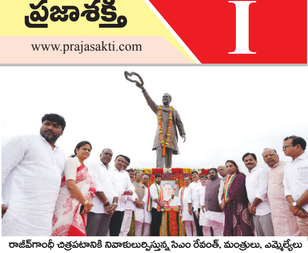
రాజ్‌విగాంధీ చిత్రపటానికి నివాళులుర్పిస్తున్న సిఎం రేవంత్, మంత్రులు, ఎమ్మెల్యేలు

సమీక్షలో చెప్పిన ఆదేశాల మేరకు రాష్ట్రవ్యాప్తంగా 37 ఆరోఎండిబీ డివిజన్ల నుంచి వివరాలు సేకరణ చేస్తున్నామన్నారు. 24 గంటలు ఆర్టికా ఉంటున్నామని స్పెషల్ సీఎస్ విశాన్‌మిట్ట మంత్రికి తెలిపారు. అత్యవసర పరిస్థితుల్లో సెలవుపై వెళ్ళిద్దన్న ఆదేశాలు పాటించు ప్రతి ఆరోఎండిబీ అధికారి నిబద్ధతతో పనిచేశారని మంత్రి చెప్పారు. గత పది రోజులుగా కురుస్తున్న భారీ వర్షాలకు వచ్చిన వరద ప్రవాహాలకు రాష్ట్ర వ్యాప్తంగా ఇప్పటివరకు ఆర్ అండ్ బీ పరిధిలో 739 చోట్ల సమస్యాత్మక రోడ్లు గుర్తించామన్నారు. అందులో 854 కి.మీ రోడ్లు దెబ్బతిందనీ, 25 చోట్ల రోడ్లు తెగిపోతే వెంటనే ఐదు చోట్ల తాత్కాలిక పునరుద్ధరణ చేశామని ప్రభుత్వ స్పెషల్ సీఎస్ మంత్రికి వివరించారు. 310 చోట్లలో కాజీవేలు, కల్వర్సులు వరద ప్రవాహం ఉంటే అందులో 228 చారి మళ్ళింపు చేసినట్లు పేర్కొన్నారు. రాకపోకలకు ఇబ్బంది ఉన్న 232 ప్రాంతాల్లో యుద్ధ ప్రాతిపదికన 175చోట్ల క్లియర్ చేశామని అన్నారు. మొత్తంగా 200 చోట్లలో రోడ్లు, కాజీ వే, ఫైనర్ బ్రిడ్జిలు, కల్వర్సులు తాత్కాలికంగా, శాశ్వతంగా పునరుద్ధరించాలని ప్రాథమికంగా గుర్తించినట్లు చెప్పారు. తాత్కాలిక పునరుద్ధరణకు రూ. 46 కోట్లు వరకు ఖర్చవుతుందన్నారు. శాశ్వత పునరుద్ధరణ కోసం రూ. 984 కోట్లు అవసరమవుతుందనూ వెనీసట్లు వివరించారు. రోడ్ల డ్యామేజీ, ప్రజల రాకపోకలకు సంబంధించి ఎలక్ట్రానిక్ మీడియా, పలు దినపత్రికల్లో వార్తలు చూశానని వాటి శ్రేత స్థాయి పరిస్థితి మంత్రి ఆరా తీశారు.