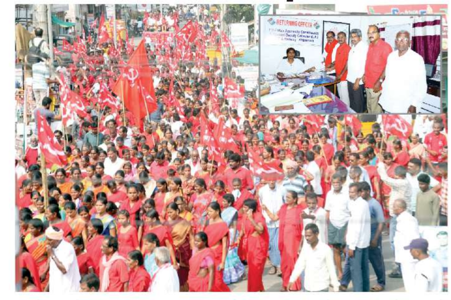
నామినేషన్కు ర్యాలీగా వెలుతున్న సిపిఎం నాయకులు, ఇన్స్ సిలీలో ఎన్మికల అధికాలికి నామినేషన్ పత్రాలు అందజేస్తున్న తమ్మినేని

రేపు ఏ పార్టీలో ఉంటారో వాళ్లకైనా తెలుసా? అని (పశ్చించారు. వీళ్లు రాజకీయ దళారీలు తప్ప నాయకులు కాదన్నారు. కాంగ్రెస్ హ్యాండ్ పార్టీ కాదు, హ్యాండిచ్చే పార్టీ అని ఎద్దేవ చేశారు. బిజెపిని ఓడించాలనే చిత్తశుద్ది